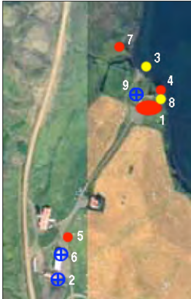
Mynd 2. Loftmynd af staðsetningu fornleifa nr. 3:1-9 við Úlfljótsvatn og nánasta umhverfi bæjarins. Sömu skýringar og á mynd 1. Ath. að fornleifar nr. 4, 7 og 35 eru ekki á þessari mynd (sjá mynd 1). Viðbætur BFE.

Sæta þarf þeim skilmálum sem embættið kann að setja í því sambandi.